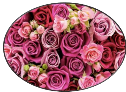
Día de la madre (mayo)