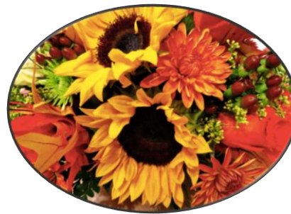
Día de Acción de gracias (noviembre)