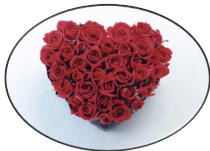
San Valentín (14 de febrero)